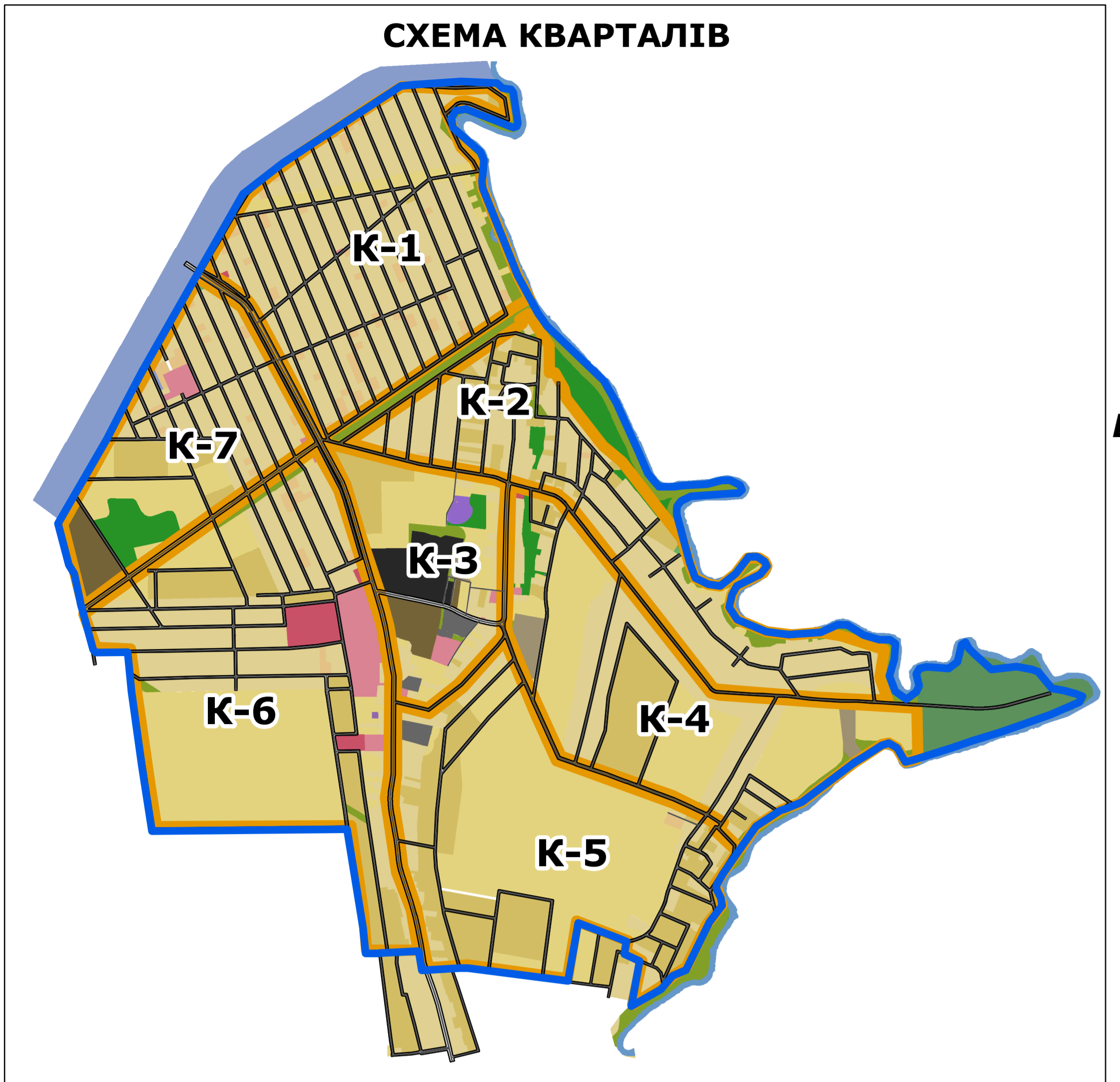
К-1, К-3, К-5, К-7 - житлові квартали з можливістю розміщення громадських територій